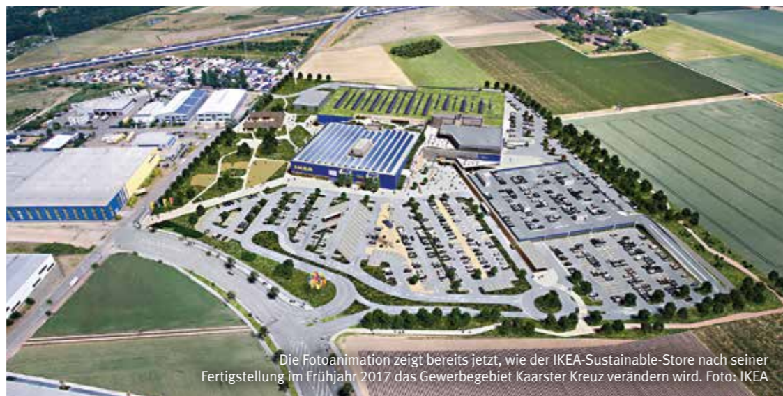
Die Fotoanimation zeigt bereits jetzt, wie der IKEA-Sustainable-Store nach seiner Fertigstellung im Frühjahr 2017 das Gewerbegebiet Kaarster Kreuz verändern wird.

geschaffen werden. Die neue Erschließungsstraße mit Brückenbauwerk sowie das neue Einrichtungshaus sollen Anfang 2017 fertiggestellt sein und damit das Gesicht des Gewerbegebietes „Kaarster Kreuz“ völlig verändern. Der Sustainable-Store könnte hier auch eine Vorreiterrolle für die Gesamtausrichtung des Gewerbegebietes übernehmen. In diesem Gewerbegebiet können mittelfristig noch rund 12 ha Gewerbefläche entwickelt und durch innovative Unternehmen belegt werden.