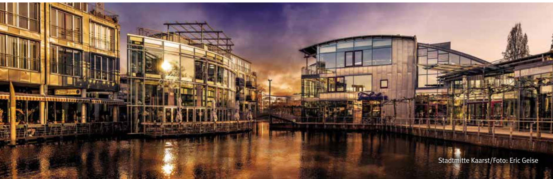
Stadtmitte Kaarst

Die Einzelhändler mit ihrem abwechslungsreichen Angebot in der modernen Kaarster Stadtmitte rund um das Rathaus sowie im Ortskern Büttgen laden zum entspannten Einkaufsbummel ein. Eine individuelle persönliche Beratung ist hier noch selbstverständlich. Auch die kulinarische Vielfalt der Kaarster Gastronomie und die einzelnen Wochenmärkte mit ihren attraktiven Frischeangeboten ziehen die Kunden an.